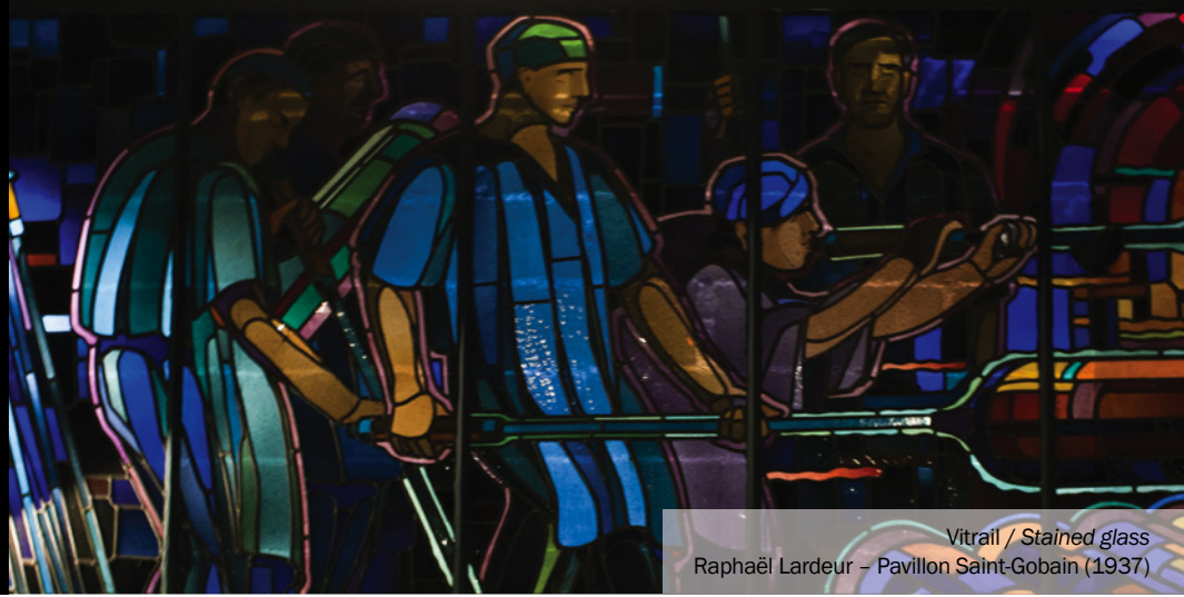
Vitrail / Stained glass Raphaël Lardeur - Pavillon Saint-Gobain (1937)